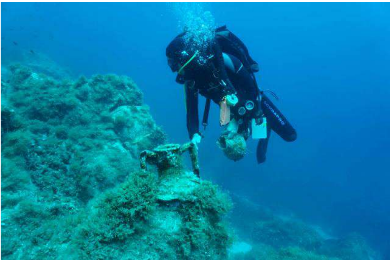
Υποβρύχια αρχαιολογική έρευνα στον θαλάσιο χώρο της Δήλου.

Αποτυπώθηκαν επίσης τοίχοι κτισμάτων και δομικά στοιχεία πεσμένης κιονοστοιχίας στον αιγιαλό κατά μήκος της ακτογραμμής εντός και βορείως του ιερού λιμένα. Βόρεια του λιμενοβραχίονα και σε μικρό σχετικά βάθος εντοπίστηκαν τα υπολείμματα ενός ναυαγίου της ύστερης Ελληνιστικής εποχής, με κύριο φορτίο αμφορείς για τη μεταφορά κρασιού και λαδιού, από την Ιταλία και τη Δυτική Μεσόγειο. Στο πλαίσιο της έρευνας πραγματοποιήθηκε η φωτογράφιση και η χαρτογράφηση δυο ακόμη ναυαγίων που εντοπίστηκαν κατά τις προηγούμενες ερευνητικές περιόδους στις θαλάσσιες περιοχές των Φούρνων και του Κάτω Κενεράλε.