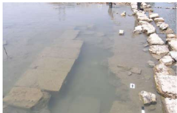
Καταβυθισμένο τμήμα κρηπιδώματος πιθανόν μεγάλου δημόσιου οικοδομήματος παρά τον λιμένα της αρχαίας πόλης της Σαλαμίνας, στη βόρεια πλευρά του Όρμου.

σήμερα, σε βουρκώδες περιβάλλον, μεγάλη σιβαρή κατασκευή, από λιθόπλινθους, επιμελούς εμφάνισης, σε μήκος 13 μ. Πρόκειται, κατά πάσα πιθανότητα, για κρηπίδα (με εντοπισμένη ισχυρή θεμελίωση στο νότιο σκέλος της) κτηριακής κατασκευής δημόσιου χαρακτήρα.