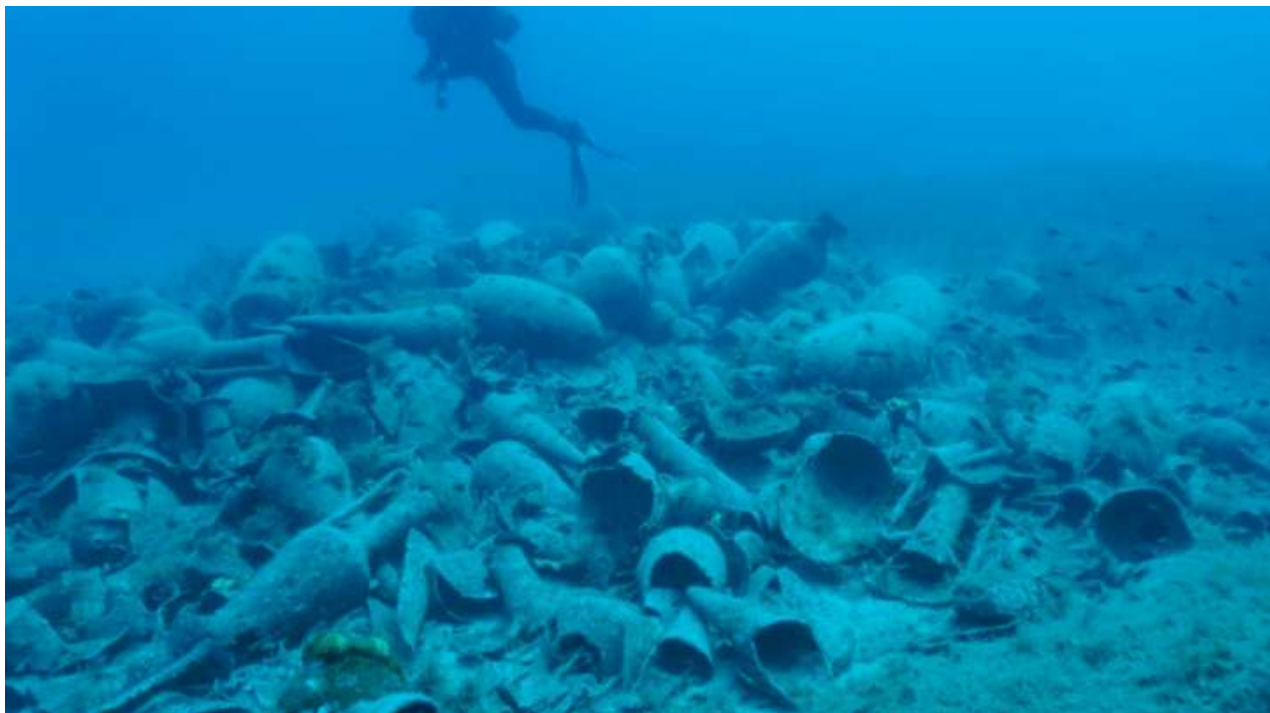
Αρχαίο ναυάγιο στη θαλάσσια περιοχή των Φούρνων.

Στα ευρήματα της έρευνας του 2017 περιλαμβάνονται ναυάγιο με φορτίο χιακών αμφορέων, χρονολογούμενο στον 4ο αιώνα π.Χ., ναυάγιο ρωμαϊκών χρόνων με φορτίο αμφορέων τύπου Dressel 38, οι οποίοι προέρχονται από εργαστηριακές εγκαταστάσεις της Ισπανίας και προορίζονταν για την μεταφορά παστών ψαριών, δύο ναυάγια ύστερων ρωμαϊκών χρόνων με φορτία αμφορέων του 6ου και 7ου αιώνα μ.Χ., αλλά και ένα ξύλινο σκαρί της εποχής του μεσοπολέμου, που βυθίστηκε λίγο μετά το 1929. Από τα ναυάγια αυτά ανελκύστηκαν δειγματοληπτικά αμφορείς, επιτραπέζια κεραμική και λύχνοι. Η εκτενής ποικιλομορφία των φορτίων και η εύρεση πολλών ναυαγίων με επείσακτα, εκτός Αιγαίου, φορτία, φαίνεται να επιβεβαιώνει τα συμπεράσματα των ερευνών του 2015 και 2016, ότι οι Φούρνοι