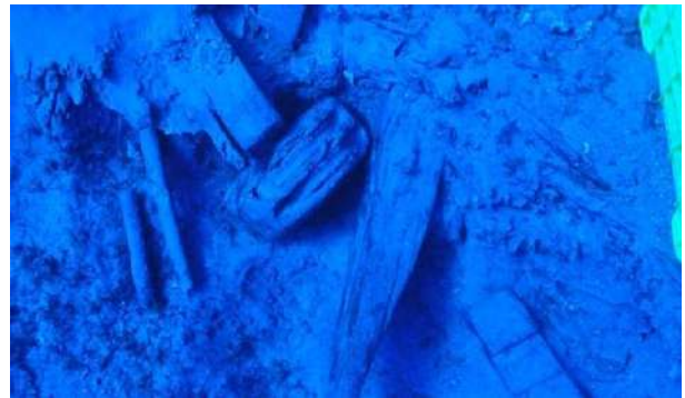
Ξύλινα στοιχεία από το σκαρί του πλοίου ΜΕΝΤΩΡ.

Κατά τη διάρκεια της φετινής υποβρύχιας ανασκαφής ερευνήθηκε τομή (Τομή 1/2017) διαστάσεων περίπου 3μ.Χ2μ. σε περιοχή προς την πλώρη του πλοίου. Αν και στο χώρο δεν σώζεται σε καλή κατάσταση το σκαρί του πλοίου, βρέθηκε