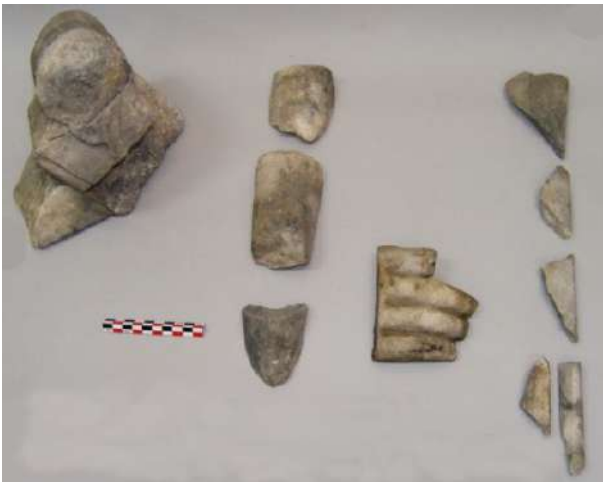
Μαρμάρινα ευρήματα Ρωμαϊκών χρόνων, από την έρευνα του μεγάλου οικοδομήματος στη βόρεια πλευρά του Όρμου: θραύσματα βωμίσκου (αριστερά) και αγαλμάτων.

Η μορφή του κρηπιδώματος, μαζί με τα άλλα αρχιτεκτονικά στοιχεία και τα κινητά ευρήματα, σε συνδυασμό με την εύρεση παλαιότερα (το 1882), σε άμεσα γειτονικό σημείο, μαρμάρινου βάθρου αγάλματος με αναθηματική επιγραφή (I.G. II2 1955), οδηγούν στην προκαταρκτική ερμηνεία του κτηρίου ως ναού ή στοάς, σε λειτουργία κατά την Υστερορωμαϊκή εποχή, ιδρυμένου πιθανώς σε παλαιότερους, Υστεροκλασικούς-Ελληνιστικούς χρόνους.