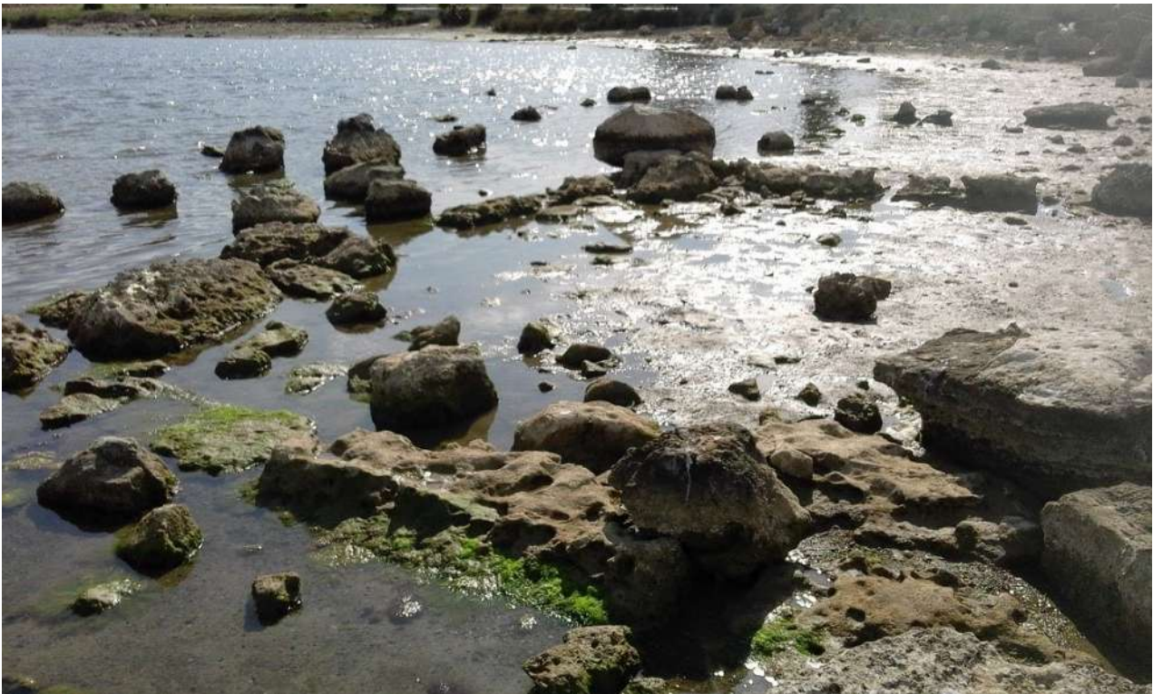
Καταβυθισμένα οικοδομικά λείψανα στα Αμπελάκια Σαλαμίνας.

τον Καθηγητή Γιώργο Παπαθεοδώρου, με κύρια συνεργάτιδα την Αναπλ. Καθηγήτρια Μαρία Γεραγά.