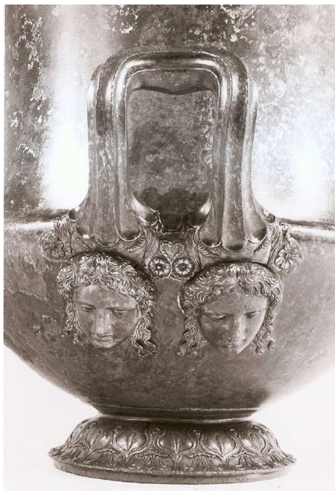
Λεπτομέρεια από τον χάλκινο καλυκωτό κρατήρα του τάφου « Heuzey β».

τάφου «Heuzey β», είναι από τα λίγα σωζόμενα σήμερα παραδείγματα του σχήματος στον 4ο αι. π.Χ. Το μικρό χρυσό νόμισμα, κοπή του κόρα Πιζώδαρου, διέφυγε από την αρπαγή των κλεφτών και βρέθηκε λίγα μέτρα έξω από την είσοδο του τάφου «Heuzey α», δίνοντας άλλη μια φορά την αφορμή να επανέλθει η ιστορία των σχέσεων του κόρα δυνάστη με τους μακεδόνες βασιλείς Φίλιππο και Αλέξανδρο.