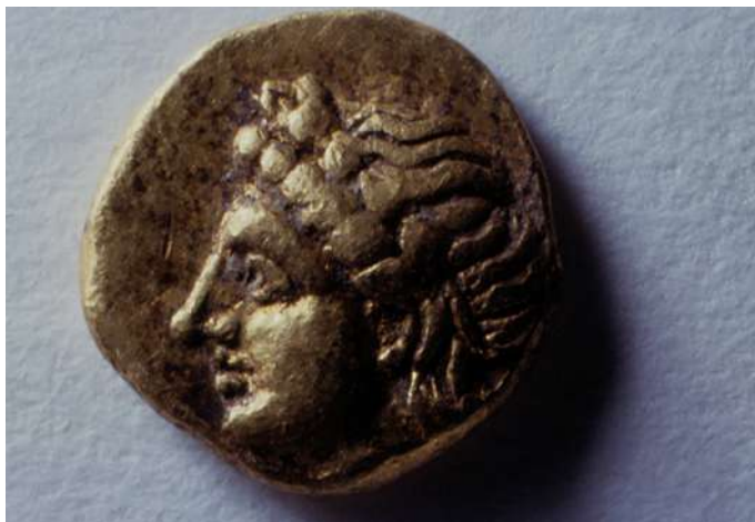
Το χρυσό καρικό νόμισμα του Πιζώδαρου από τον τάφο «Heuzey α».