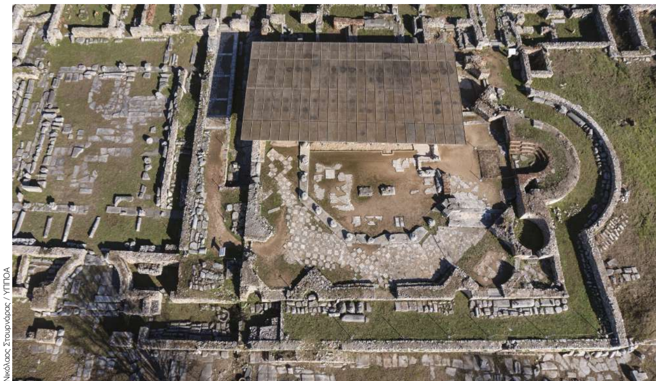
Νικόλαος Στουρνάρας / ΥΠΠΟΑ