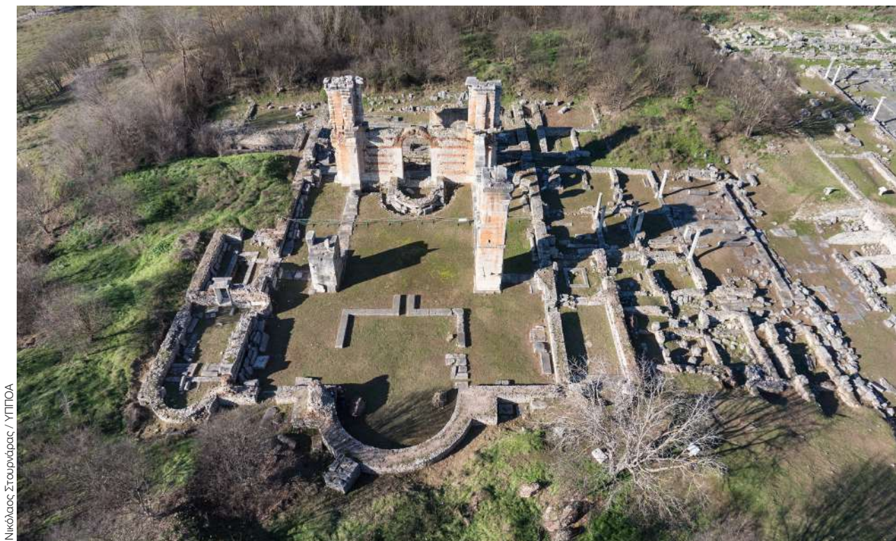
Νικόλαος Στουρνάρας / ΥΓΠΟΑ